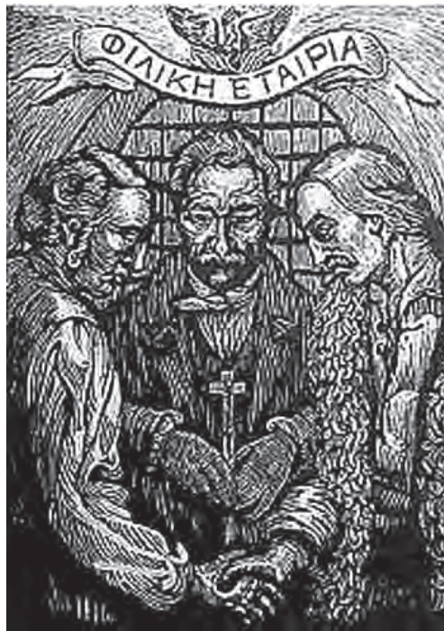
▲ Ο όρκος των Φιλικών

Η Φιλική Εταιρεία ιδρύθηκε επτά χρόνια πριν από την έναρξη της Μεγάλης Επανάστασης του 1821, με σκοπό να συντονίσει τις προσπάθειες των υπόδουλων Ελλήνων για την απελευθέρωσή τους. Η οργάνωση ιδρύθηκε μυστικά στην Οδησό της Ρωσίας, το 1814 , από τρεις άσημους εμπόρους, τον Εμμανουήλ Ξάνθο , το Νικόλαο Σκουφά και τον Αθανάσιο Τσακάλωφ .